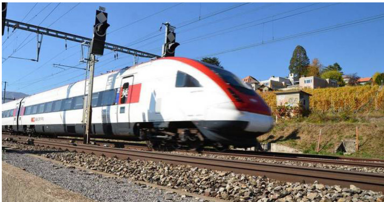
Train IC5 sur la ligne du Pied-du-Jura

À cette occasion, l'Alliance a critiqué la réduction importante du montant alloué au financement des installations de transport de marchandises. Il a en outre été rappelé la position des villes, arguant que les économies réalisées par le report de renouvellement d'infrastructures et la suppression de fonctionnalités ne doivent pas peser sur l'offre du trafic voyageurs.